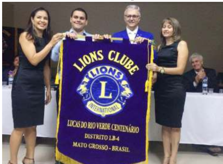
Fundação do LC Lucas do Rio Verde Centenário (Divisão 07)