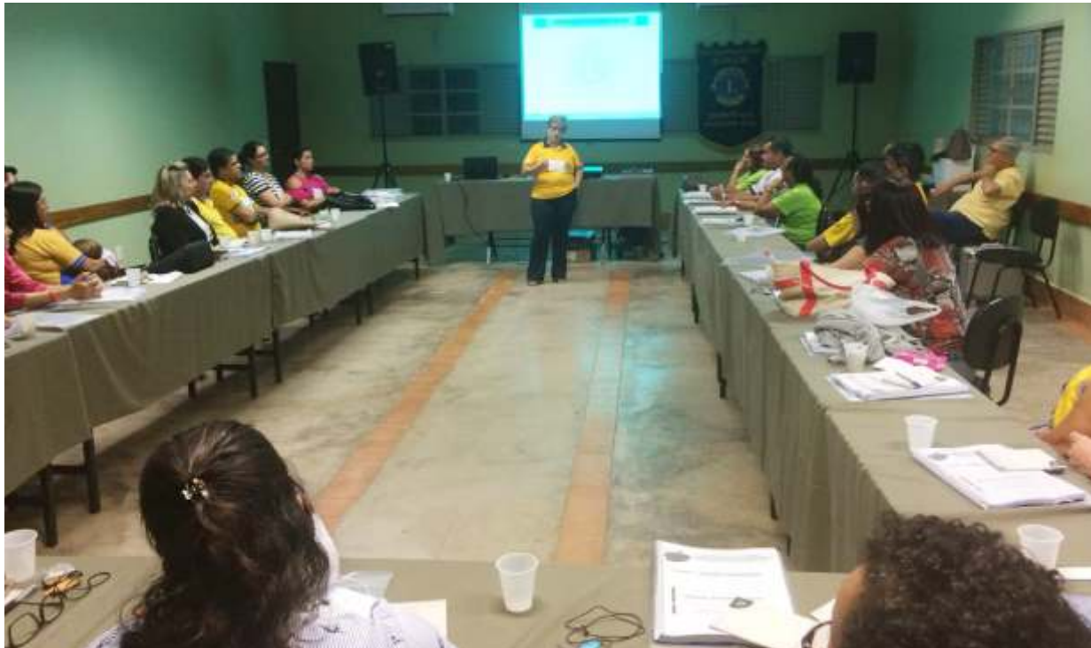
Novos instrutores durante treinamento, em dezembro de 2017