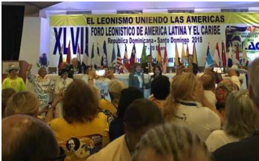
Fórum Internacional em Santo Domingo